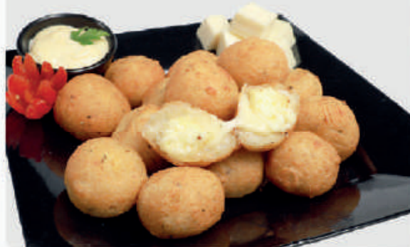
cód: 1102 BOLINHO 4 QUEIJOS 10x350g