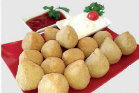
cód: 3540 COXINHA DE FRANGO COM REQUEIJÃO 10x350g