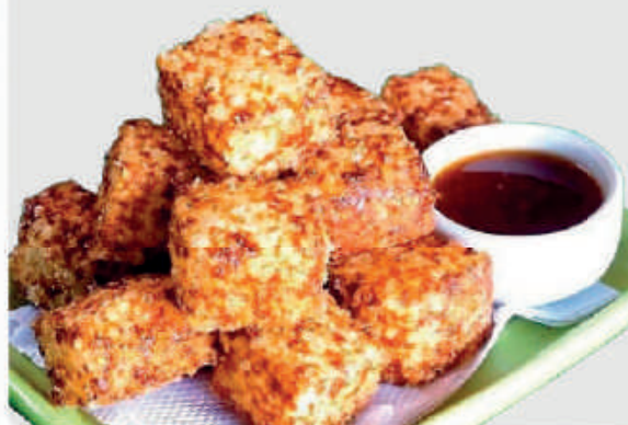
cód: 1249 DADINHO DE TAPIOCA COM QUEIJO COALHO 10x350g