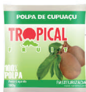
Cupuaçu 20x100g (2kg) - cód: 81601