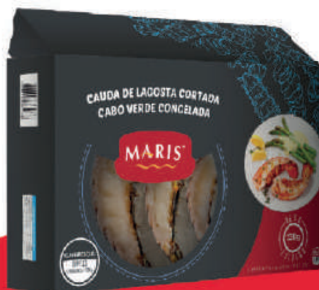
Cauda de Lagosta Cortada