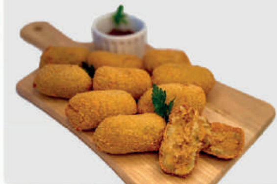
cód: 793 BOLINHO DE COSTELA SUÍNA C/ BARBECUE 10x350g