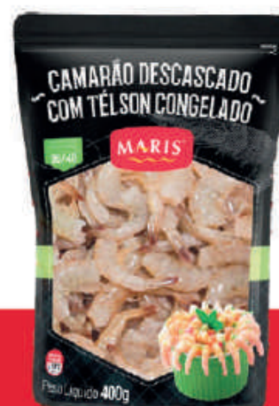
Camarão Descascado Com Têlson Congelado