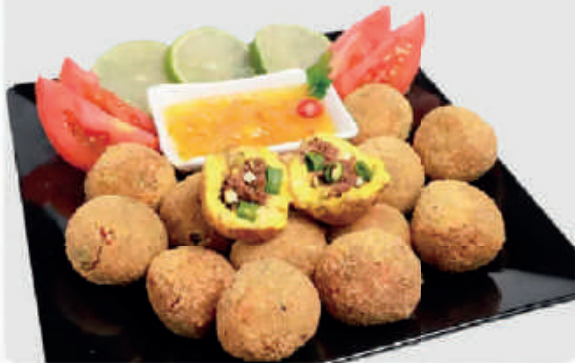
cód: 1137 BOLINHO LAMPIÃO KABUTIA COM CARNE 10X350g