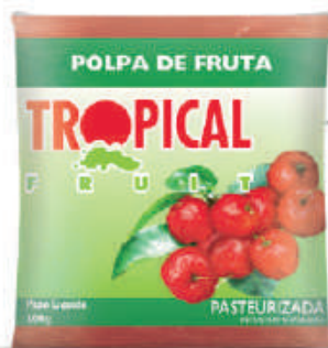
Acerola 20x100g (2kg) - cód: 21601