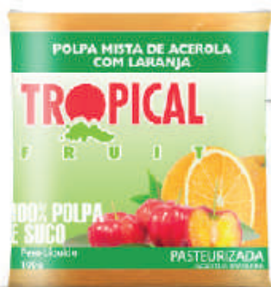
Acerola c/ Laranja 20x100g (2kg) - cód: 261501