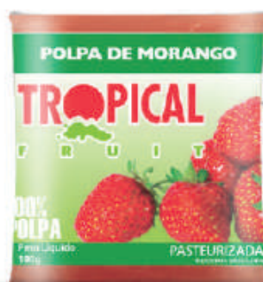
Morango 20x100g (2kg) - cód: 191501