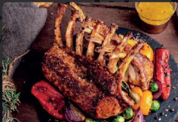
COSTELA DE CORDEIRO COM OSSO