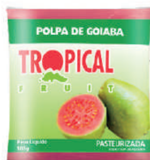
Goiaba 20x100g (2kg) - cód: 91601