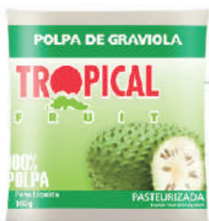
Graviola 20x100g (2kg) - cód: 401601