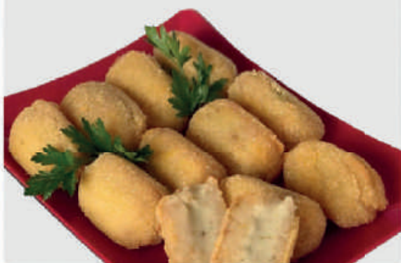
cód: 1928 BOLINHO DE TILÁPIA RECHEADO COM QUEIJO 10x350g