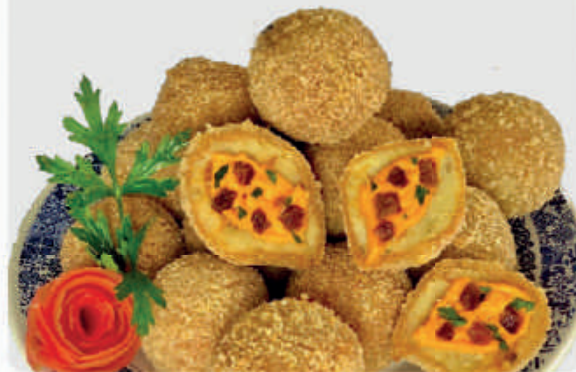
cód: 1184 BOLINHO MARIA BONITA BATATA, CHEDDAR E BACON 10x350g