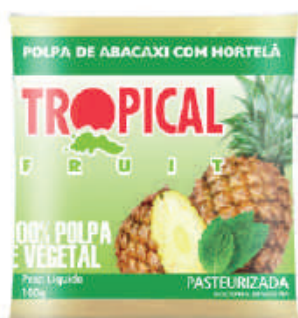
Abacaxi c/ Hortelã 20x100g (2kg) - cód: 221501