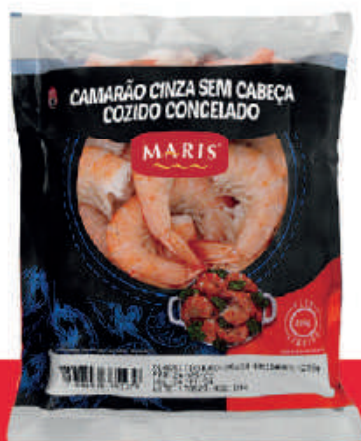
Camarão Sem Cabeça Congelado