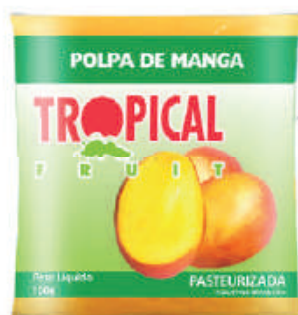
Manga 20x100g (2kg) - cód: 121601