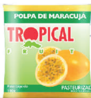
Maracujá 20x100g (2kg) - cód: 191801