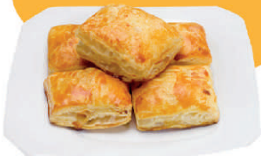
cód: 14809 FOLHADO NAPOLITANO COQUETEL