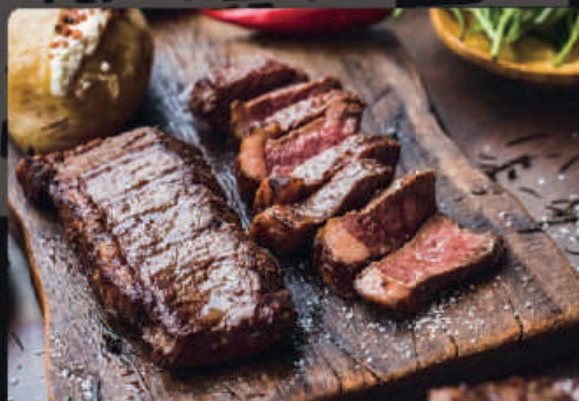
PICANHA BOVINA ANGUS FATIADA