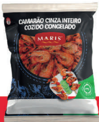
Camarão Inteiro Congelado