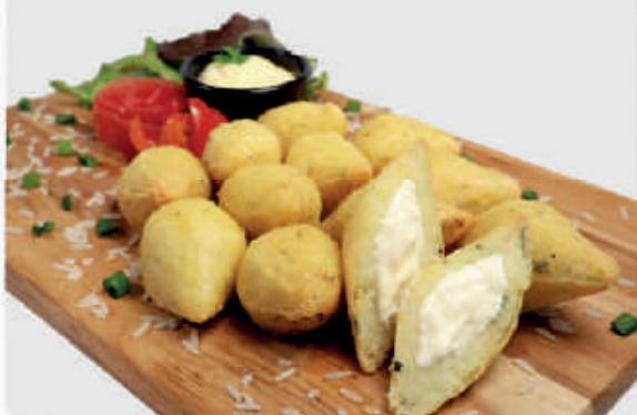
cód: 10028 BOLINHO DE ARROZ COM PROVOLONE E REQUEIJÃO 10x350g