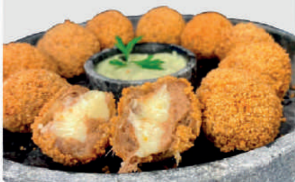
cód: 2977 BOLINHO DE COSTELA DESDIADA COM QUEIJO 10x350g