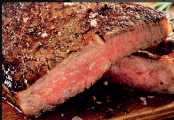
PICANHA BOVINA ANGUS PEÇA