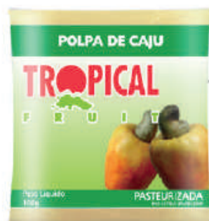
Caju 20x100g (2kg) - cód: 61601