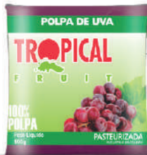
Uva 20x100g (2kg) - cód: 221601