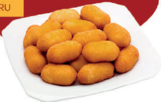
cód: 19313 BOLINHO DE QUEIJO COQUETEL 1,0Kg