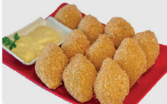
cód: 1747 BOLINHO RECHEADO COM CAMARÃO 10x350g