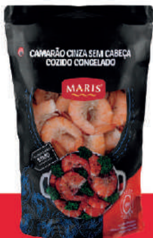
Camarão Sem Cabeça Congelado