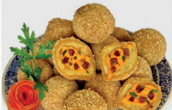
cód: 1981 DISQUINHO DE COSTELA COM CHEDDAR E BACON 350g