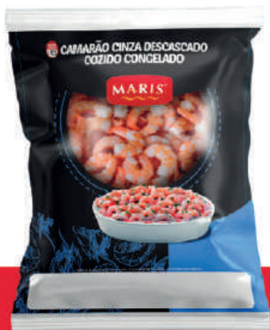
Camarão Descascado Cozido Congelado