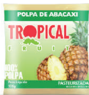
Abacaxi 20x100g (2kg) - cód: 181010