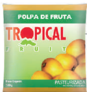
Cajá 20x100g (2kg) - cód: 61601