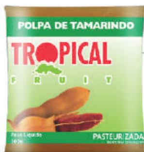
Tamarindo 20x100g (2kg) - cód: 191501