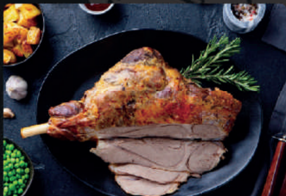
PERNIL DE CORDEIRO COM OSSO