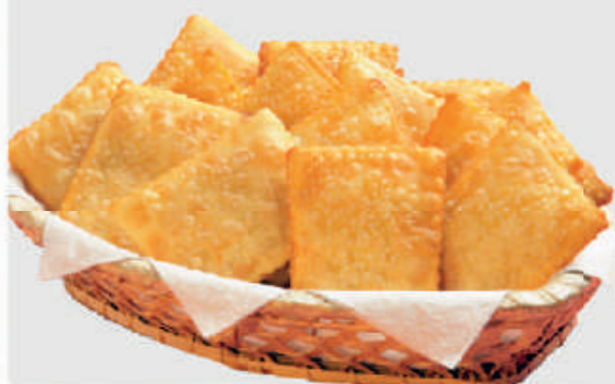
cód: 200538 PASTEL RECHEADO DE CARNE COM QUEIJO 350g