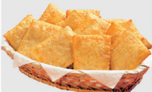
cód: 107900 PASTEL RECHEADO COM QUEIJO 10x350g