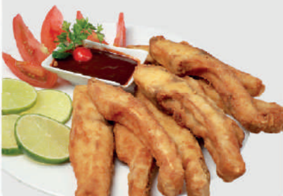
cód: 1135 COSTELA DE TAMBAQUI TEMPERADA EMPANADA 450g