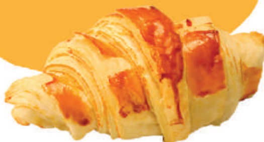
cód: 19371 CROISSANT FRANGO COQUETEL 1,0Kg