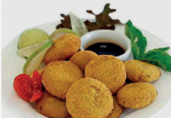
cód: 1929 DIŞQUINHO DE FILE DE TILÁPIA 350g